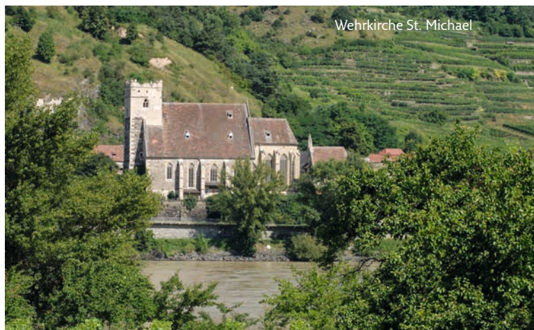
Wehrkirche St. Michael