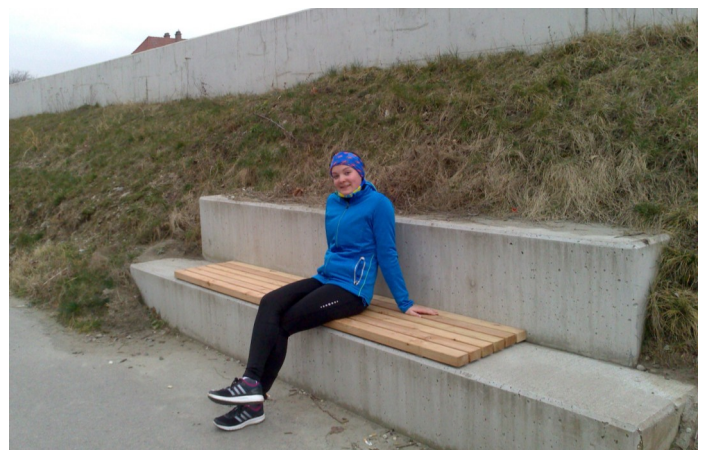
Der Bauhof hat durch Holzauflagen die Bänke am Trepelweg attraktiver gemacht. Damit wurde eine Idee der Dorferneuerung umgesetzt.