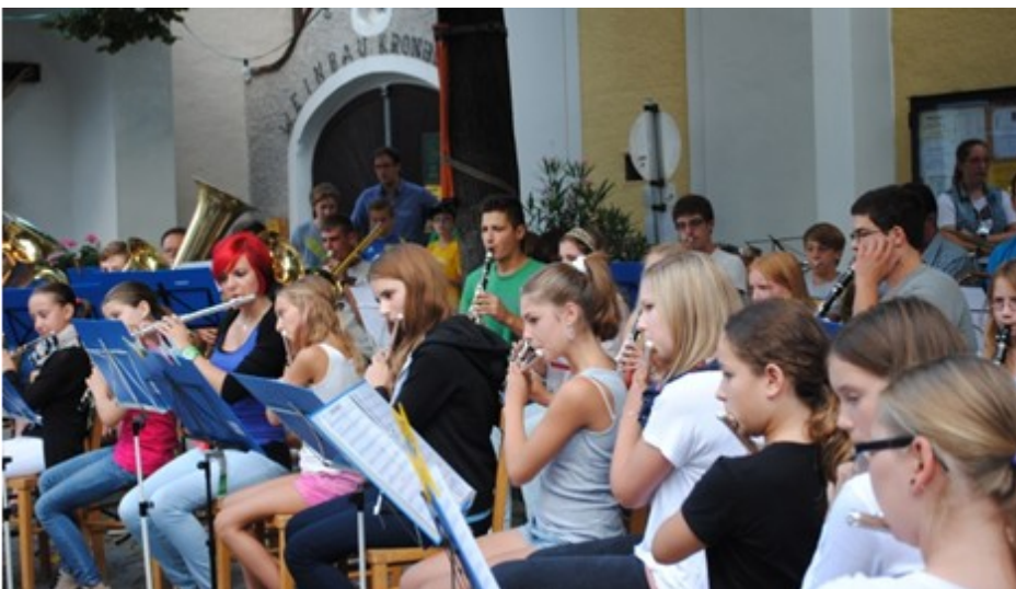
Jugendorchester - „Wachauer Kracherl“