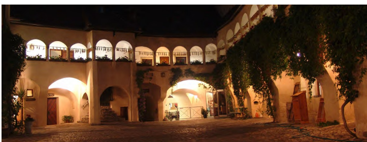
Unser Teisenhoferhof, das kulturelle Zentrum unserer Gemeinde.